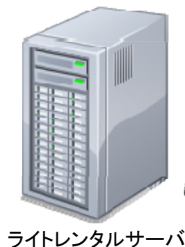
ライトレンタルサーバ