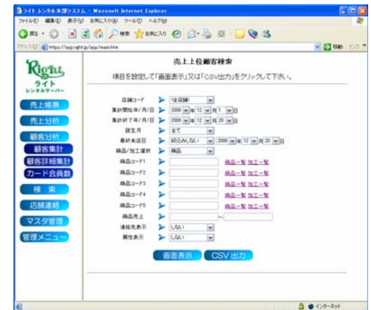
顧客詳細集計画面